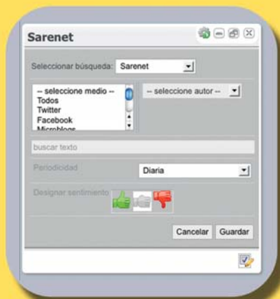
Editando la configuración.