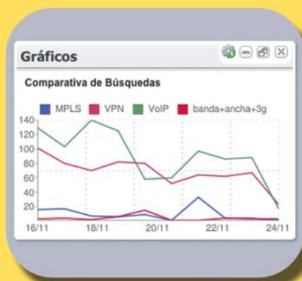
Gráfico de comparativa de búsquedas.